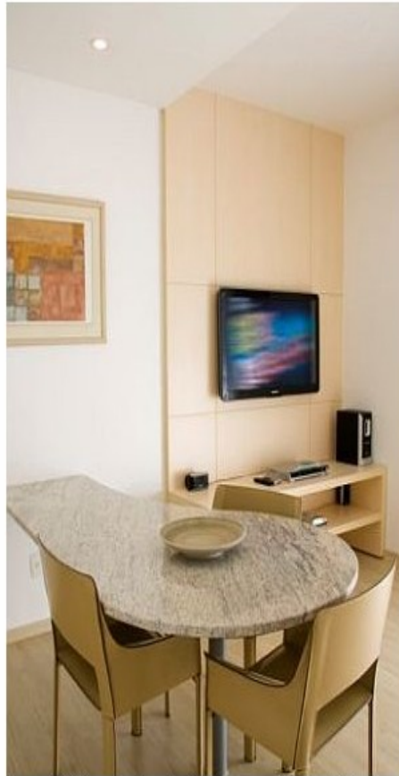
Outra visão da UH com a TV de LCD